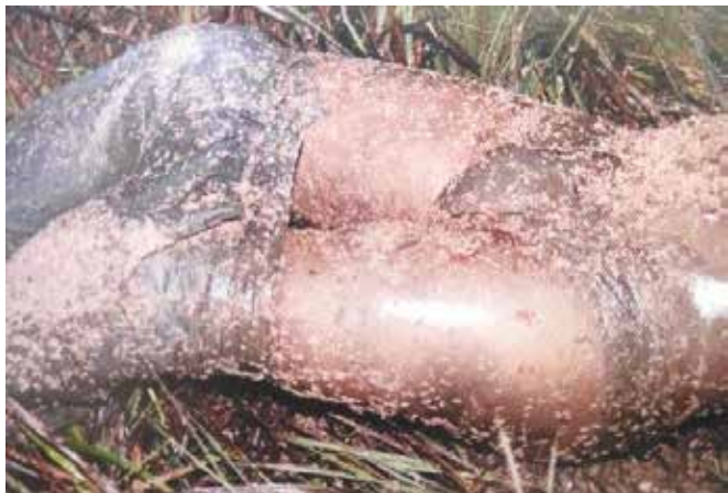
VELHO, Jesus Antônio et al. Ciências forenses: uma introdução às principais áreas da Criminalística moderna . 3. ed. Campinas: Millenium Editora, 2017.

A fotografia de local de crime apresentada evidencia parte do tronco e pernas de um cadáver, sobre solo com vegetação rasteira, que veste calça e cueca. Essa imagem também revela a grande quantidade de larvas sobre os vestígios. Com base exclusivamente na imagem da fotografia apresentada, assinale a alternativa que melhor discrimina o corpo de delito.